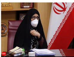
مشاور حقوقی و پارلمانی معاونت امور زنان ریاست جمهوری مطرح کرد:

جبران خلاهای قانونی حمایت از زنان با اجرای لایحه منع خشونت علیه زنان