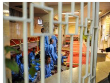
مشاور حقوقی و پارلمانی معاونت امور زنان و خانواده، از تدوین

تدوین لایحه‌ای برای کاهش مجازات‌های کودکان مرتکب جرایم