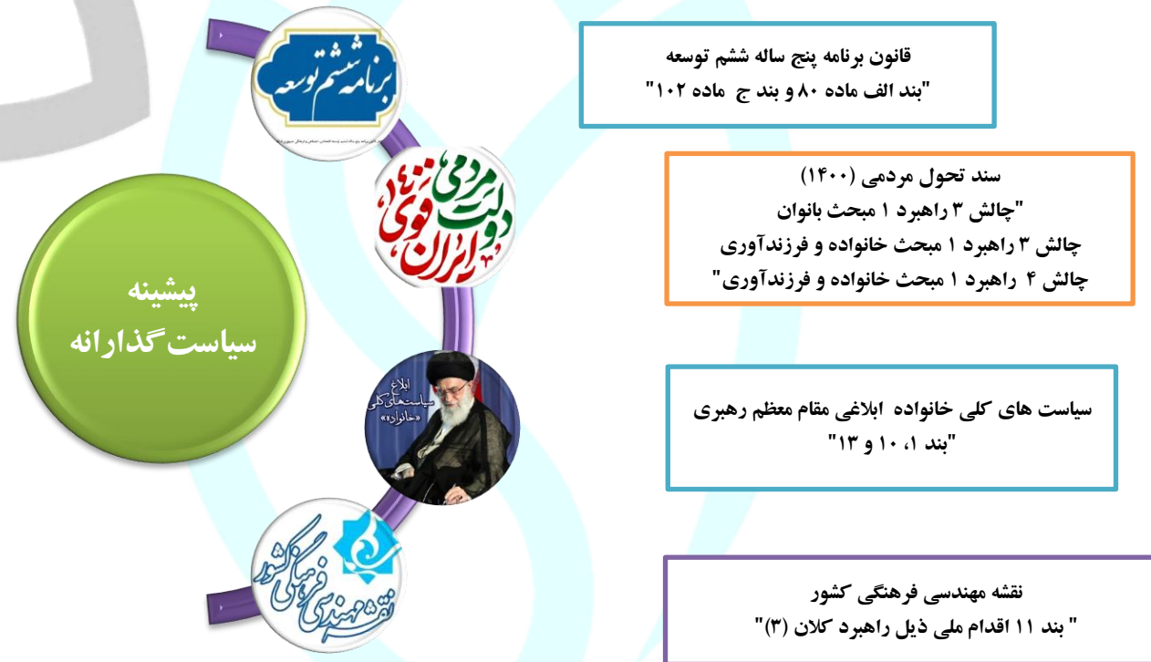
تصویر ۱- اسناد فرادستی و پیشینه سیاست گذاران طرح نو همسران در یک نگاه