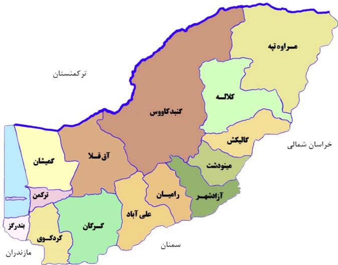
شکل ۳. نقشه استان گلستان