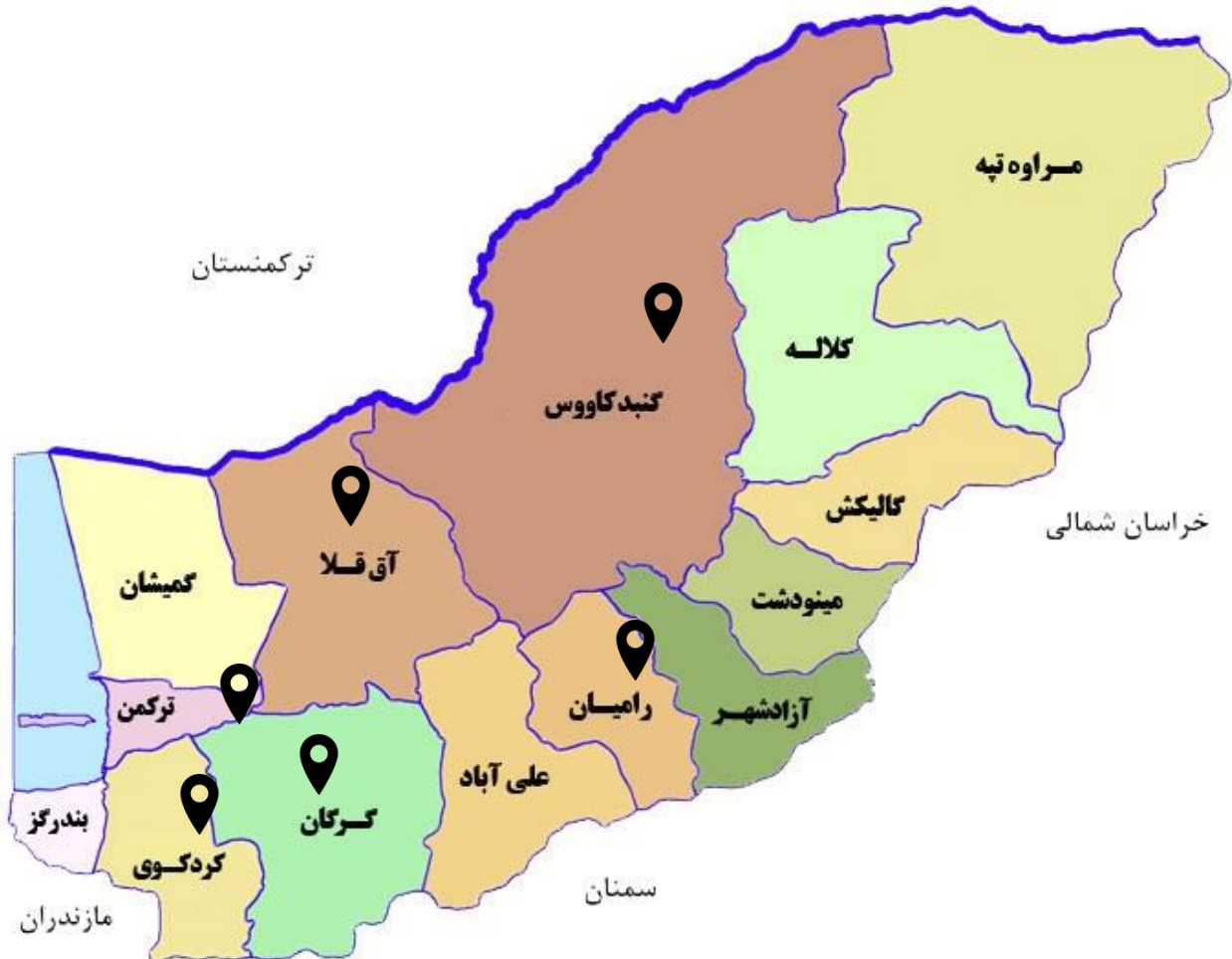
شکل ۶. نقشه گستردگی فعالیت‌ها در مناطق استان