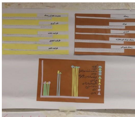
شکل ۵. گالری تصاویر فاز ۱ طرح ارتقاء تاب‌آوری اجتماعی