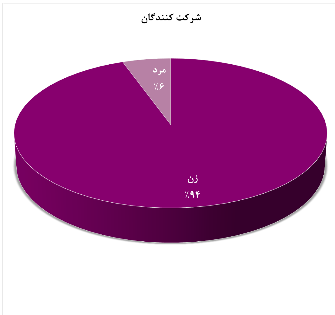
شکل ۷. نمودار جنسیت شرکت کنندگان