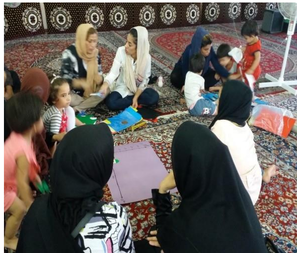
شکل ۲۸- گالری تصاویر فاز ۲ طرح ارتقاء تاب آوری اجتماعی