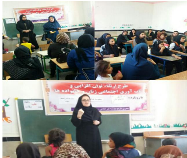
شکل ۲۹- گالری تصاویر فاز ۲ طرح ارتقاء تاب‌آوری اجتماعی